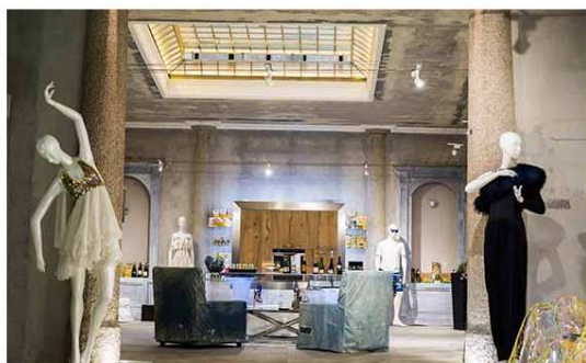
Successo per la Special Cocktail Party & 3D

Home Teatro Cinema Musica Tempo libero Video La squadra