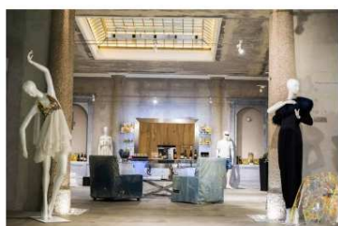
Hyper Room – Lo showroom interattivo

Condividi: Facebook Twitter Google+ Pinterest Segnala via mail